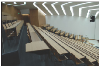
Hörsaal im Gebäude HPH